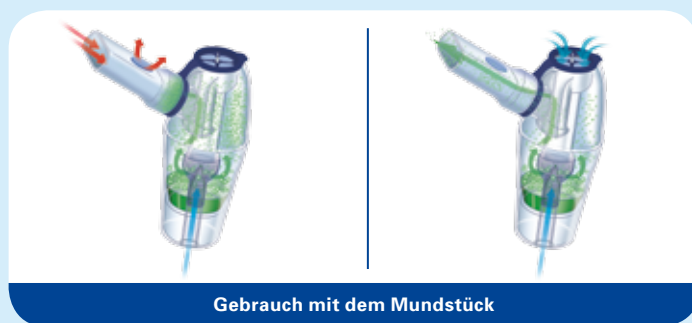
Gebrauch mit dem Mundstück