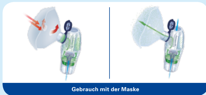
Gebrauch mit der Maske